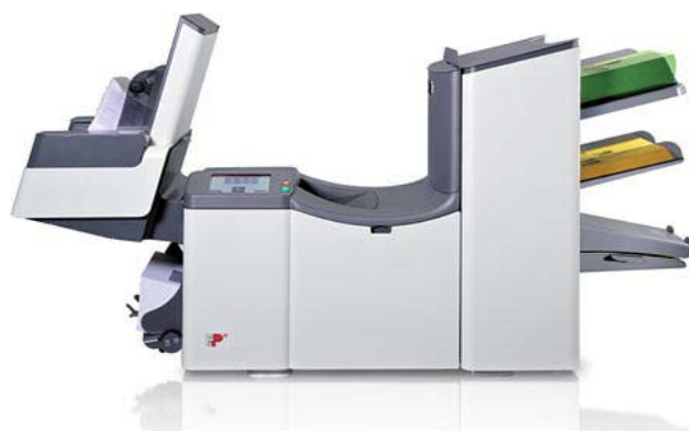
FPI 4520 med HCVS