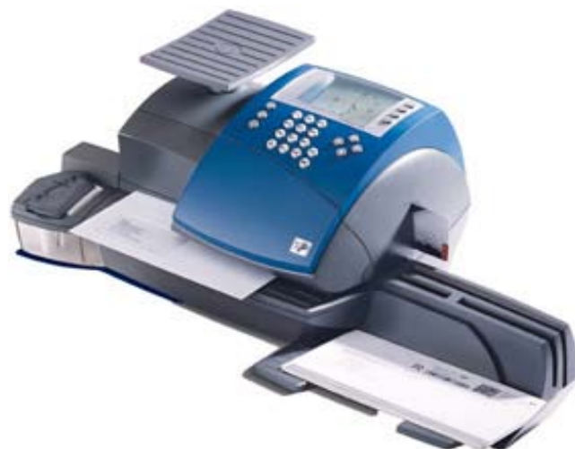
Optimail30 m/vekt og limeenhet

Oppdatering av nye portosatser via ladesentralen eller kort