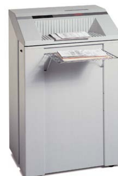
Intimus 007 SE