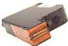
Collins Ink patron

Postrom Maskiner AS leverer et bredt utvalg av blekk for profesjonelle printere som bruker HP TIJ 2,5 printhoder. Ta kontakt for pris!