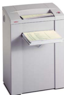
Intimus 602 HS