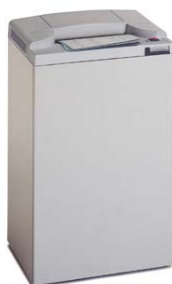
Intimus 502 HS