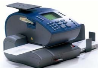
Ultimail m/ innebygget 5 kg portovekt

Ultimail er en digital frankeringsmaskin for mellomstore volum Portovekt har statistikkfunksjon som gir ekstra portorabatt i form av bonus på porto Kan leveres med negativ veiing (maskinen veier og beregner porto på det man fjerner) Automatisk start med sensor Kan brukes til stemping av "porto betalt" Mulighet for opptil 9 firmalogoer Skriv dine egne tekstmeldinger! Vi har flyttet til...., God Jul etc. Innebygget kortleser, for portooppdatering, access etc Intern printer for utskrift av telleverk, avd. konti og statistikk Varsler ved lite tilgjengelig porto Statistikkmuligheter som gir full rabatt på porto A-prioritaire, B-economic og REK er inkl. i prisen