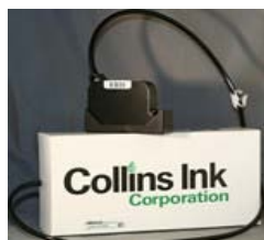
Collins Ink bulk