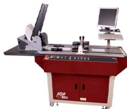
HS1500F m/Streamfeeder og PC controller