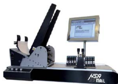
HS600F m/Streamfeeder og PC controller

Et alternativ til Streamfeeder kan være Grütmacher stand-alone matere