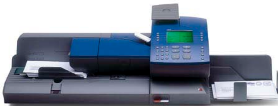
Ultimail m/automatisk mater