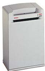
Intimus 302 HS