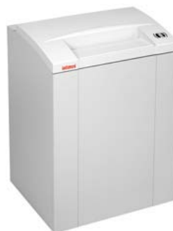
Intimus 175 CC5