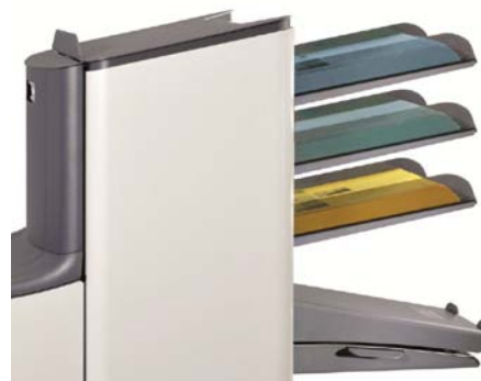
FPI4530 har 3 A4 matere

FPI4500 serien er beregnet på mellomstore og store volum, fra 200 til et par tusen pr dag "Fill & Start" funksjonen setter en ny standard i brukervennlighet Legg inn ark og konvolutter, maskinen ordner resten! Selvforklarende bruk fra "touch screen" panelet Real sheet controll. Ingen fotoceller som dekkes av støv, arkets faktiske tykkelse blir målt, slik at feil unngås. Brettekapasitet på opptil 10 ark Hastighet på opptil 3.600 brev pr time 20 programmerbare jobber Håndterer C6/5 og C5 konvolutter 3 fleksible A4 matere, som også kan brukes til vedlegg Papirkapasitet på hele 325 ark pr mater Håndterer 60 - 250g papir Matere med forvalgsteller Kapasitet på ca 325 tomme konvolutter Svært støysvak (66 dB)