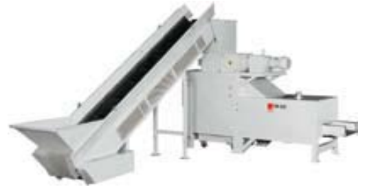
VZ 19.00 montert i vinkel