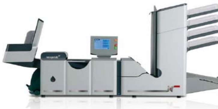
FPI5540 m/ HCVS