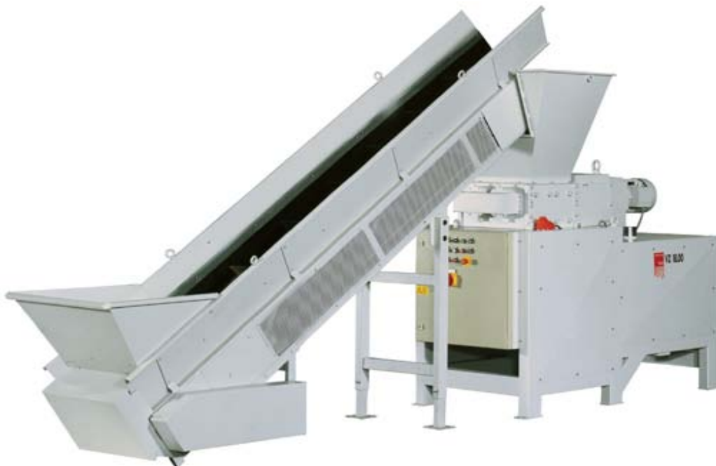
VZ 17.00 med automatisk innmating fra container med "laksetrapp"